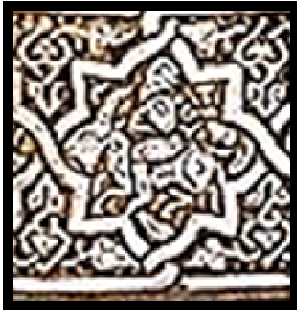
(ب) تفصيلا من للمبخرة