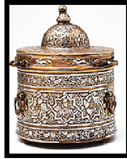
(أ) مبخرة من العصر المملوكي

شكل رقم (١) يوضح احتواء الأشكال الهندسية أشكالاً عضوية