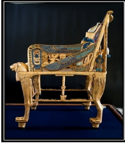
شكل (٤) صورة جانبية لكروى العرش للملك توت عنخ امون الدولة الحديثة

وتمثلت العناصر الزخرفية الهندسية فى مجموعة الخطوط المستقيمة التى تشكل فيما بينها مساحات مطعمة تزين اسفل الواجه الامامية للظهر وكذلك مجموعة المربعات المنتظمة والمتساوية والمطعمة التى تزين قاعدة الكروى ومجموعة الخطوط الحلزونية التى تزين الحافة الخارجية ، كما تمثلت العناصر الزخرفية النباتية فى مجموعة زهور اللوتس والبردى المحفور حفرة بارزا والمكسوة بصفائح الذهب والتى تزين الوجهة الخلفية للظهر الداخلى ، وتمثلت العناصر الزخرفية الادمية فى صورة الملك والملكة المطعمة والتى تزين الوجهة الامامية للظهر الداخلى كما تمثلت العناصر الحيوانية فى راسى الاسد محفورتان حفرا مجسما والمغطاة بالذهب