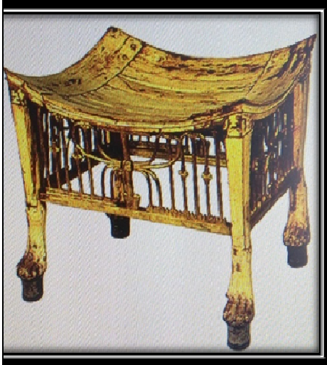
شكل (١٠) كرسى للملك توت عنخ امون استخدمت فيه رقائيق الذهب