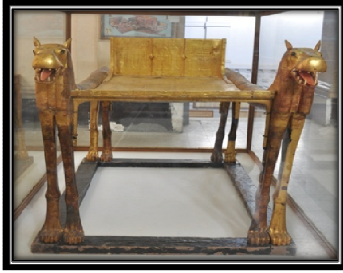
شكل (٢) سرير جنازى ذو رأس فرس نهر للملك توت عنخ آمون "الدولة الحديثة الأسرة الثامنة عشر، المتحف المصرى

حقق الاتزان والايقاع والتناغم في السرير . كما اهتم بالمتانة والقوة وجودة الصنعة الى جانب الاهتمام بجمال الشكل فقد استخدم تعايشق النقر واللسان والكوايل كتراكيب صناعية في تجميع اجزاء السرير كما في الشكل (انظر الشكل رقم ٢)