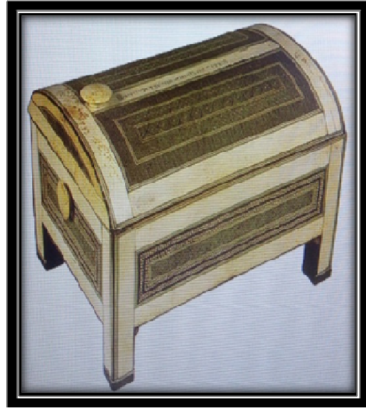
شكل (٦) صندوق خشبي مطعم بالعظم والعاج الدوله