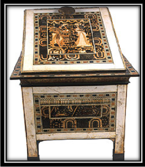
شكل (٧) صندوق فرعونى مطعم بالعاج والابنوس

تنوعت الصناديق في أشكالها من المربعة والمستطيلة. كما اختلفت أحجامها من الكبير والصغير والمتوسط. بما تتناسب مع الغرض الذى صنع من أجله، وتعددت استخداماتها بين حفظ الحلى والملابس والأسلحة وأدوات الزينة. كما فى شكلى (٦)، (٧).