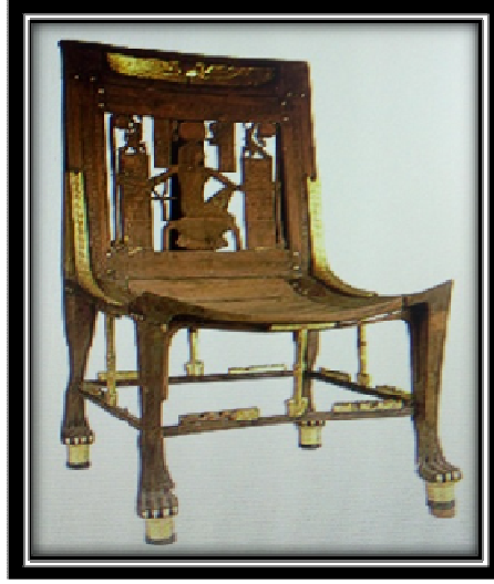
شكل (٨) كرسي للملك توت عنخ امون يوضح استخدام رقائق المعادن

اسم صاحب المسكن، وبعض الرموز السحرية. كما كانوا يصنعون أطيّار من النحاس حول الأبواب، وكانت للأبواب عوارض تحل محل الأقفال، مصنوعة من الخشب أو المعدن... (١٤) غطت بالذهب، ولكن أكثر سمكاً من تلك الأوراق الذهبية المستعملة لتغطية النقوش البارزة المحفورة في بقية الكرسي. شكل (٨)