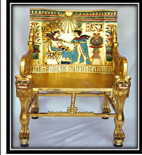
شكل (٥) صورة امامية لكروى العرش للملك توت عنخ امون الدولة الحديثة