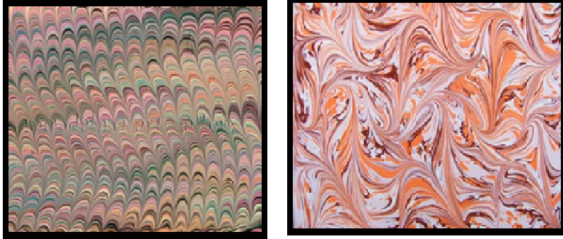
شكل ( ٣ ، ٤ )

وجماليات هذا الأسلوب تعتمد علي مسافه التباعد بين أسنان المشط فكلما كانت الأسنان متقاربه أعطت تأثيرات أدق وكلما تباعدت يحدث العكس شكل (٤) (١٧).