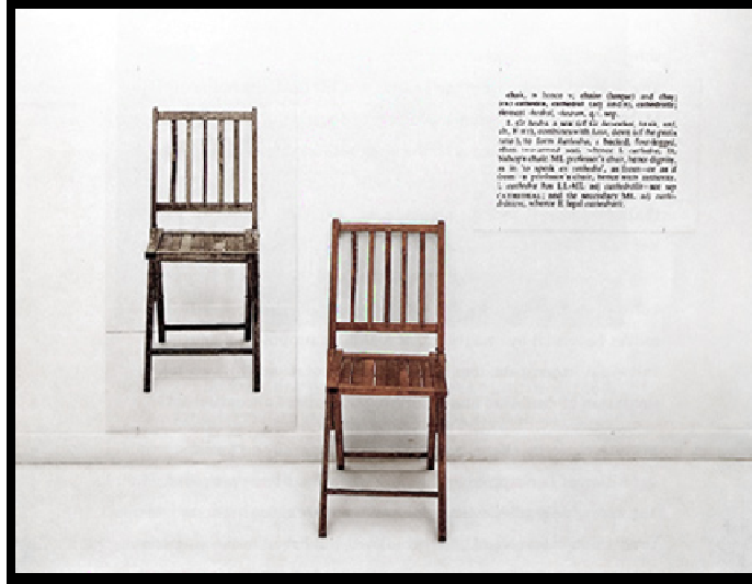
Joseph Kosuth, One two Three chairs, 1964

(Joseph Kosut) " بعمل بعنوان "واحد وثلاث مقاعد" وهو عبارة عن كرسي حقيقي وصورته الفوتوغرافية. والتحديد اللغوي لكلمة كرسي. بهدف تمثيل الشيء. ولما كان الشيء الحسي يعتبر بديهيا. فان ما يهمنا فيه هو ادراكه وفهمه. والكلام عنه يأخذ مكان الفن عندما يعبر عن بعده الجمالي بحرية حيث توجد شخصية الشيء المستخدم في الصورة بين هذه الثلاثة، هل هي في الشيء نفسة، أم فيما يمثله أم في الوصف الكتابي أو الشفوي، وإذا كان من الممكن اكتشاف هذه الشخصية في الأشياء الثلاثة.