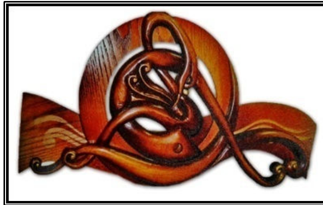
شكل (٥) (أسماء الموجي، ٢٠١٢، ص ٢٢٠) نوع العمل: وحدة إضاءة معلقة

الخامات المستخدمة: خشب زان - مسطحات mdf - قشرة أخشاب قرو