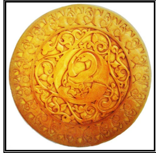
شكل (٣) (حامد محمود، ٢٠٠٠، ص ١٨٧)