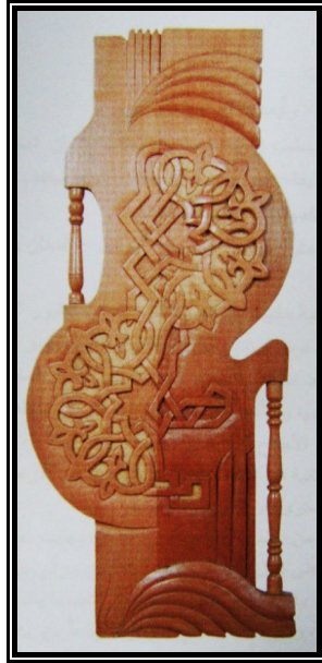
شكل (٤) (رافع رافع، ٢٠٠٦، ص ٣٢٦)