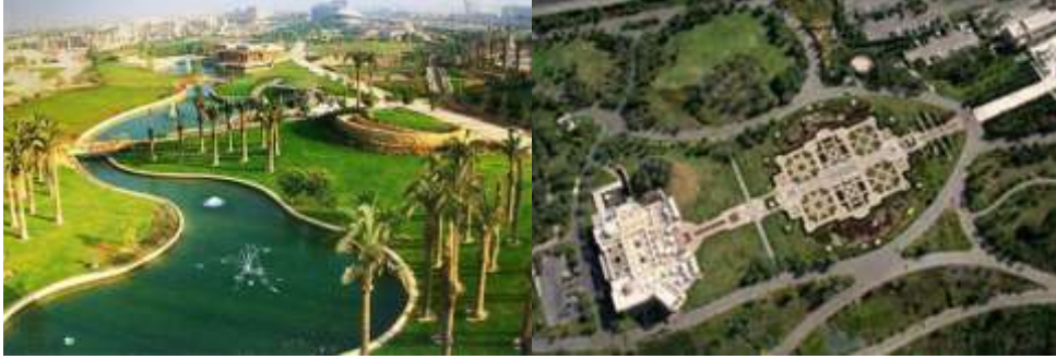
صورة (٤) حديقة الأسرة- القاهرة