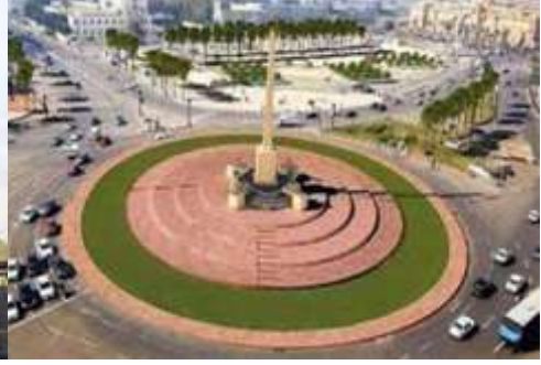
صورة (٩) ميدان التحرير - القاهرة