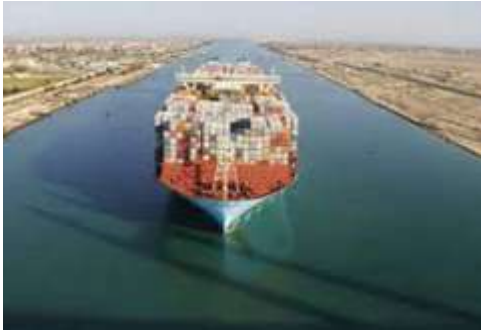
صورة (١٢) قناة السويس

هناك العديد من أنواع المسطحات المائية (المحيطات، البحار، البحيرات، القنوات، الأنهار،....)، وهي تشكل غالبية المساحة الإجمالية للكرة الأرضية. (صورة ١١، ١٢)