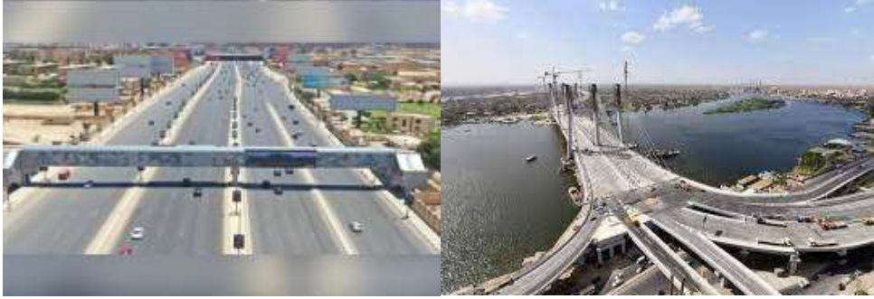
صورة (٨) كوبري مشاه سيتي ستارز-مكرم عبيد - القاهرة

ويمكن تقسيم الكباري وفق عنصرين؛ الأول: التقسيم من حيث نوع الاستخدام (كباري مخصصة للسيارات أو المشاة، كباري السكة الحديد،...)، والثاني: من حيث مواد البناء المستخدمة: (كباري خرسانية، معدنية،....). (صورة ٧، ٨)