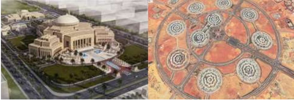
صورة (١) مبنى الأوكتاجون المصري الجديد (الكيان العسكري) - العاصمة الإدارية الجديدة صورة (٢) مجلس النواب - العاصمة الإدارية الجديدة

تعتبر المباني العنصر الأكثر تميزاً ووضوحاً في عناصر التصميم العمراني، كما أن التصميم الجيد للمباني مع بعضها البعض يعطي للمكان طابع مميز، ويؤكد على هوية المكان سواء كانت المباني كلاسيكية أو مباني ذات طابع حديث أو مباني تجمع بين الأصالة والمعاصرة. (صورة ١، ٢)