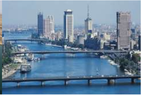
صورة (١١) نهر النيل