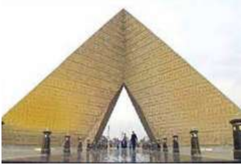
صورة (١٠) النصب التذكري للجندي المجهول - القاهرة