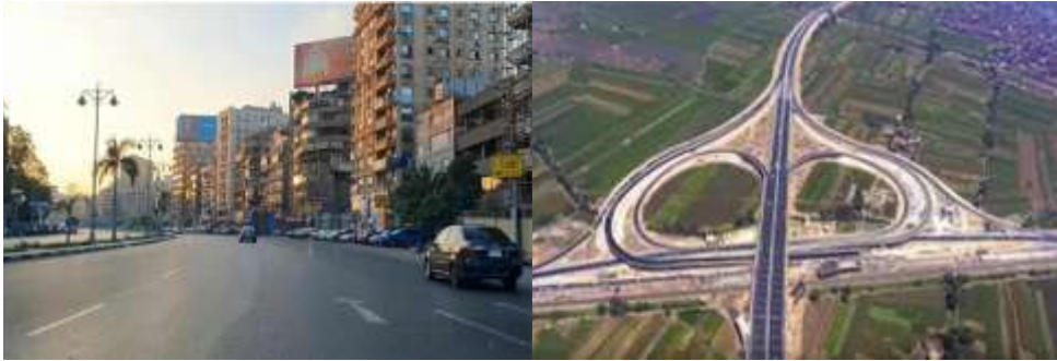
صورة (٦) شارع الميرغني - حي مصر الجديدة

هناك اختلاف كبير بين الشارع (street) والطريق (road)؛ فالشارع يمر ضمن مناطق سكنية عكس الطريق الذي يكون عادة خارج المناطق العمرانية ليصل بين مكانين أو مدينتين بعيدتين، كما أن الشارع يستخدمه المشاة والمركبات بينما الطرق عادة تكون مخصصة للمركبات فقط، كما أن الشارع يصطف بالمنازل على كلا الجانبين بينما لا يوجد العديد من المنازل على جانبي الطريق. (صورة ٥، ٦)