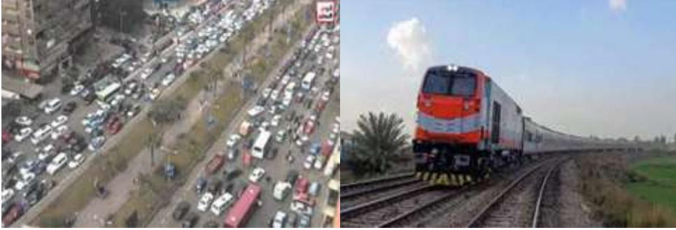
صورة (١٤) أحد الشوارع المزبحة بالمواصلات - مصر