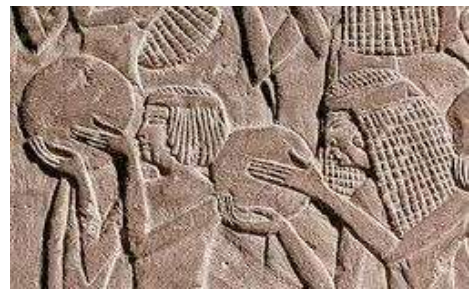
شكل (١٨) عازفات الدفوف - المتحف المصري العازفات