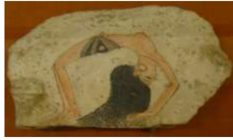
شكل (٢٠) راقصة في وضع بهلواني ، متحف تورينو