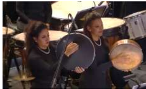
شكل (١٩) عازفات الدفوف حفل موكب المومياوات الملكية