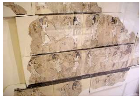
شكل (١٥) قبر المطربين والراقصين. مقبرة ست حتور- متحف اشموليان