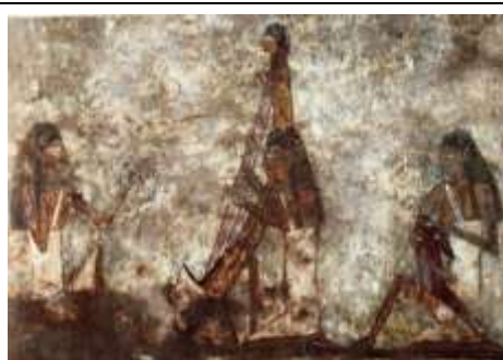
شكل رقم (١٤) خنوم حنوب الثاني الدولة الوسطى - العزف في احتفال طريق الكباش