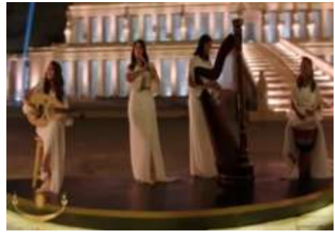
شكل (٣٨) عزف في حفل افتتاح طريق الكباش