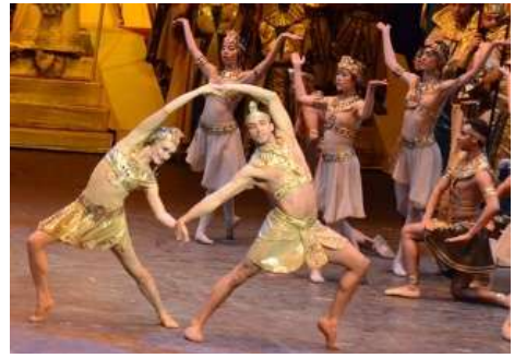
شكل (١٦) أوبرا عايدة