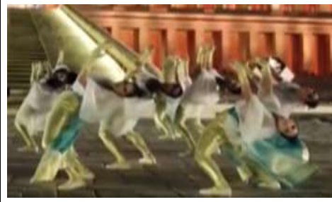
شكل (٢١) حفل موكب المومياوات الملكية https://www.youtube.com/watch