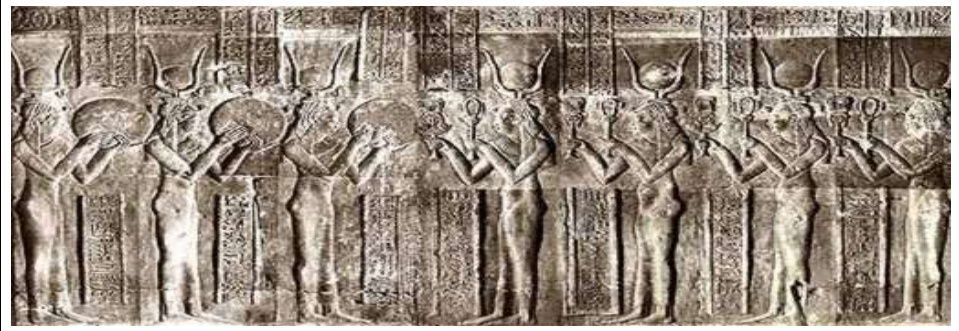
شكل (٤٩) معبد دندرة - السبع حاتحورات