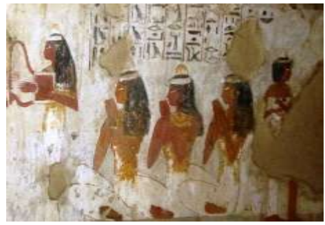
شكل (٣٧) مقبرة جسر كا