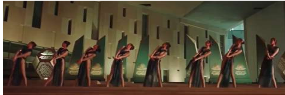
شكل (٢٤) حفل موكب المومياوات https://www.youtube.com/watch?v=sYDznh5iCY