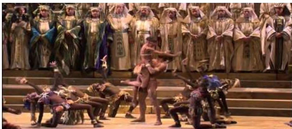
شكل رقم (١٣) مشهد من أوبرا عايدة https://www.youtube.com/watch?v=l3w4l-KElxQ