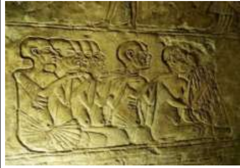
شكل (٣٩) مري رع الأول