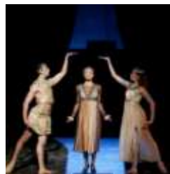
شكل رقم (١٢) مشهد من أوبرا عايدة https://www.youtube.com/watch?v=l3w4l-KElxQ