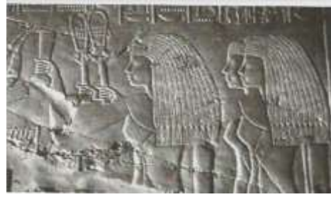
مقبرة رع موزا شكل رقم (٢٢)