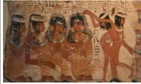
شكل (٢٣) مقبرة نب آمون المتحف البريطاني ( Thomas p.29.Gamet James