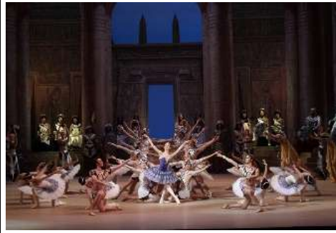
شكل (١٧) بالية أبنة فرعون