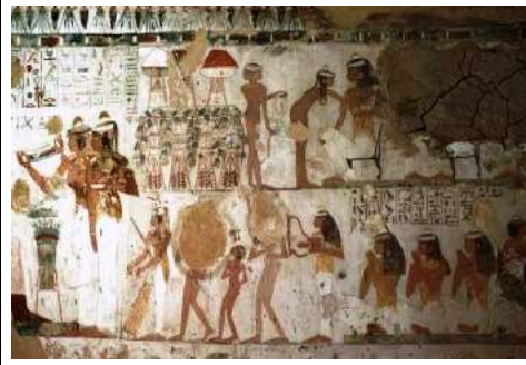
شكل (٣٧) مقبرة جسر كا المشهد كامل https://www.osirisnet.ne