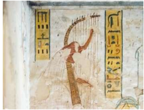
شكل (٤٠) مقبرة رمسيس الثالث عازف القيثارة