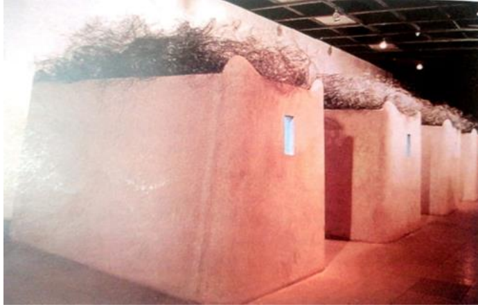
شكل (٢) وائل شوقي wael shawke ،النوبة المجمدة ،بيوت طينية مجسمة Mud houses ،سعف نخيل Palm fronds (١٩٩٦م)(مصطفى الرزاز.٢٠٠٧.ص٤٠٧)

وعلاقة الشكل بالمضمون والنسبة والتناسب وأسس التكوين ، والمعايير التي تقاس عليها قيم العمل الفني المركب .