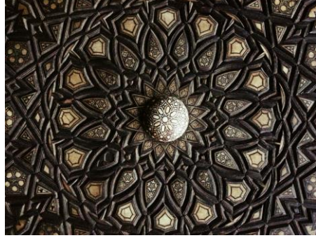
شكل (١٢) : جزء من باب يوضح أسلوب التطعيم بالحشوات المجمع لتألف أطباق نجمية ، العصر المملوكي

https://civilizationlovers.files.wordpress.com/2012/01/618_246.jpg