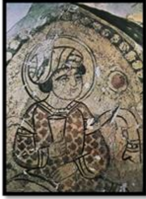
شكل (١١) : تصوير جداري من العصر الفاطمي (٣٥٨ : ٥٦٧ هـ) شاب يجلس متربعاً ويمسك بيده كأس

https://civilizationlovers.files.wordpress.com/2012/01/618_246.jpg