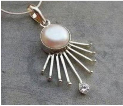
شكل ١٣ دلالية صدر من الفضة والاحجار

الحلى الشكل التقليدى وانما أصبح يحمل رموزا تحوى مدلولاً معيناً بطريقة غير واقعية فيتخذ البعض مذهباً تجريدياً و آخرون مذهباً كلاسيكياً أو سريالياً وغيرها من المذاهب ، ولكن الحلى استمرت رمزيتها الى الان فتتحدى المرأة فى المناسبات بشكل دائم ، "كخاتم الخطوبة والزواج وحلى تلبس فى مناسبات خاصة كموسم الزراعة وحلول الربيع" ٢٩ .