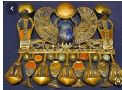
شكل ٦ قلادة صدرية من الذهب والاحجار

٢٥ الدور الفنى الدينى والسحرى للحلى وادوات الزينة عبر العصور المصرية القديمة : مجلة العمارة والعلوم الانسانية-المجلد الخامس- العدد الرابع والعشرون .