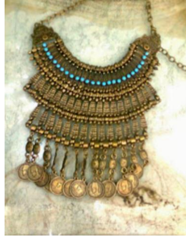
شكل ١٠ كردان شعبى من النحاس

الحلى المعدنى فى مصر حديثا : ويتطور الاتجاهات الفنية وظهور المدارس الفنية الحديثة أصبح الحلى يعتمد على عنصر التعبير كل فنان بما تهوى نفسه فى بناء تصميمه فلم يأخذ