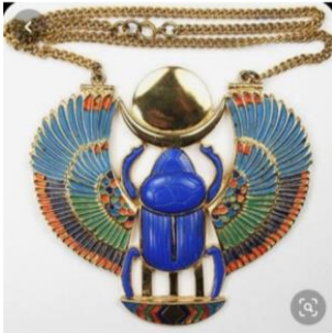
شكل ٥ سلسلة من الذهب واللازورد والجشمت

وفى عصر الدولة الحديثة انفتحت مصر على الحضارات الآسيوية مما أدى الى اخراج قطع لازالت تبهر الأبصار وتحار لها عقول زائريها فى متاحف العالم ٢٥