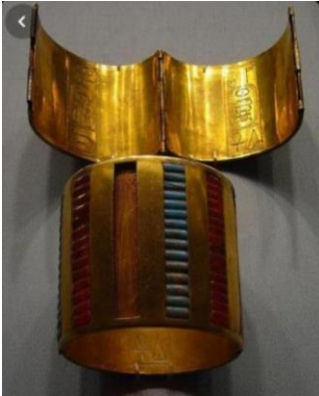
شكل (٢) سوار من الذهب والاحجار الكريمة

الحلى فى الفن المصرى القديم: "تنوعت الخامات والألوان التى استخدمها المصرى القديم فى صناعة الحلى من عصر لآخر ففى عصور ما قبل التاريخ إستخدم الأصداف والخرز والعاج ومخالب الحيوانات وعظامها ثم استخدم احجارا كريمة ونصف كريمة فضلا عن الذهب،