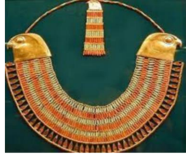
شكل (٣) قلادة صدرية للاميرة نفرو بتاح

وفى عصر الدولة الحديثة انفتحت مصر على الحضارات الآسيوية مما أدى الى اخراج قطع لازالت تبهر الأبصار وتحار لها عقول زائريها فى متاحف العالم ٢٥