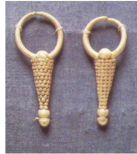
شكل ٧ قرط من عنقود العنب - المتحف القبطى