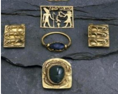
شكل (٤) مجموعة من الدلايات والخواتم

وفى العصور الوسطى بلغت الصياغة ذروتها وأظهر المصرى القديم تحكما كبيرا وقدرة فائقة فى تصنيع المعادن ومزج معدن ثمين مع معدن آخر وأبداع ما وصل اليه فن صياغة الحلى فى الدولة الوسطى (الصدريات والتيجان وقد صنعت جميعها من الذهب المطعم بالأحجار الكريمة)