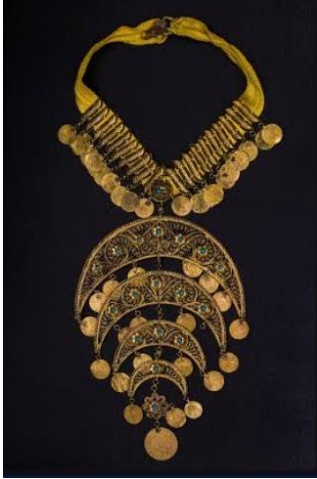
شكل ١١ كردان شعبى من الذهب والاحجار

الحلى المعدنى فى الفن الشعبى المصرى: "اتخذت المصاغ الشعبى المصرية كوسائل مادية يتحلى بها الفرد حبا فى الظهور والمباهاة، ولقد سعى الصائغ الشعبى الى هذه الغاية جاهدا بكل الوسائل، فركز على القيم والتأثيرات البصرية للحلية باخلافه لمظهرية السطوح المعدنية للحلية باستخدام التقنيات المختلفة للزخارف المتنوعة، وتزويد الحلى بالبرق والفصوص المعروفة بانعكاساتها الضوئية الباهرة" ٢٨