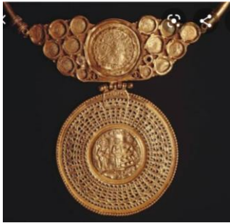
كردان يرجع للعصر القبطى - المتحف القبطى

الحلى المعدنى فى الفن القبطى: " استخدم الفنان القبطى فى تشكيل وزخرفة بعض النماذج المعدنية التى تستخدم للزينة ببعض الزخارف النباتية والثمار كعنقود العنب وأوراقه، وكان يعالج سطوح الخامات التى استخدمها ببعض وسائل الحفر الدقيق بعناصر تنزع الى تسجيل بعض الأفكار الدينية والتعاويذ السحرية وتتجه فى أنماطها الى التبسيط وتوحى الميول الشعبية الفطرية والوفاء باحتياجات التجميل" ٢٦ ، وقد ظهر فى العصر القبطى العديد من أشكال الحلى ارتبطت بمرور الدين المسيحى كالصليب الذى رسم بأشكال عديدة، وعناقيد العنب والاسماك " وتمثل هذا المصاغ فى الاقراط الشعبى القبطية التى كانت تصنع على شكل دوائر مصاغة من الفضة" ٢٧