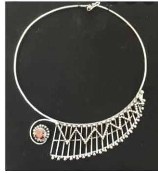
شكل ١٢ كولييه رقبه من الفضة والاحجار

أهم السمات التعبيرية التى اثرت على الحلى المعدنى فى مصر قديماً وحديثاً: